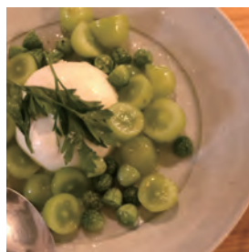
放牧豚のロースト